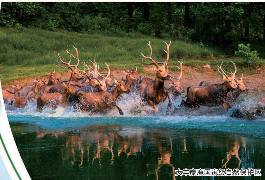
大丰麋鹿国家级自然保护区