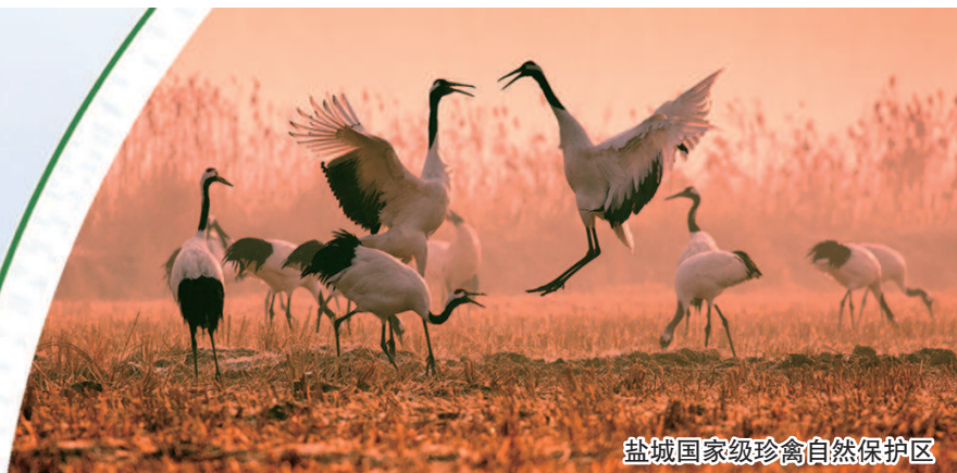
盐城国家级珍禽自然保护区