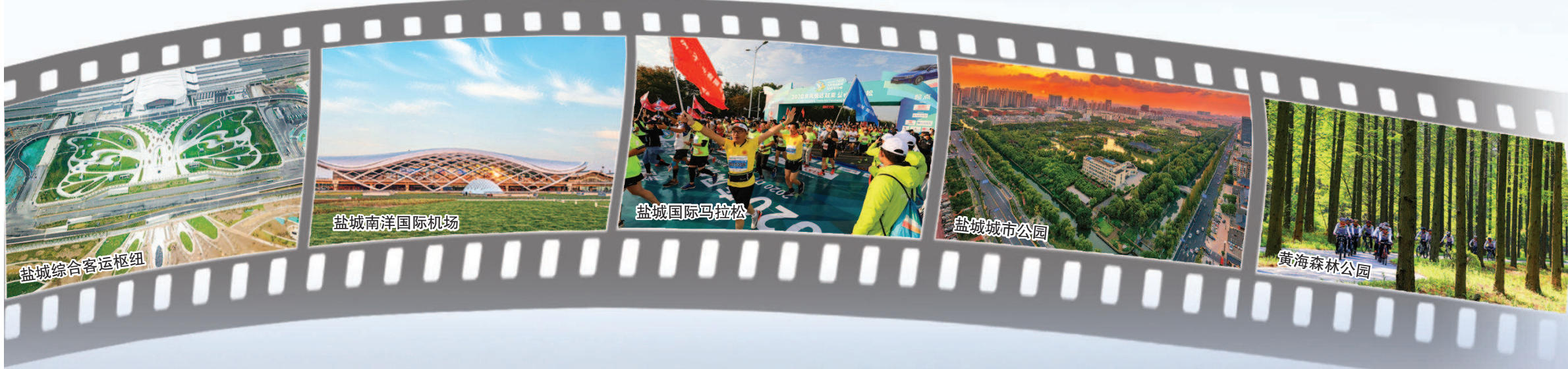
盐城综合客运枢纽