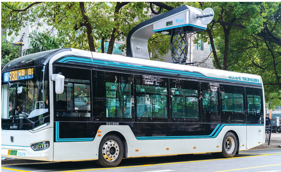
右图:930路超级电容公交车。

据悉,年底前,6个超级电容快充站完成外线送电,930路、17路、18路、隧道八线、146路新增89辆超级电容车,加上去年已经投运的11路、26路,申城超级电容公交车将超过百辆。