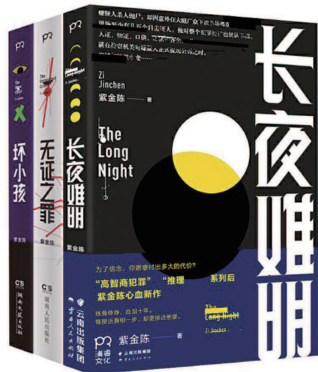
▲《无证之罪》《隐秘的角落》《沉默的真相》这些改编自紫金陈原著小说的剧集接连成为“爆款”，也让紫金陈成为了头部IP

紫金陈作品的优缺点都很明显，其笔下的文字、人物和情节设定都带着种粗糙感，但那种生猛姿态仍然让人激赏