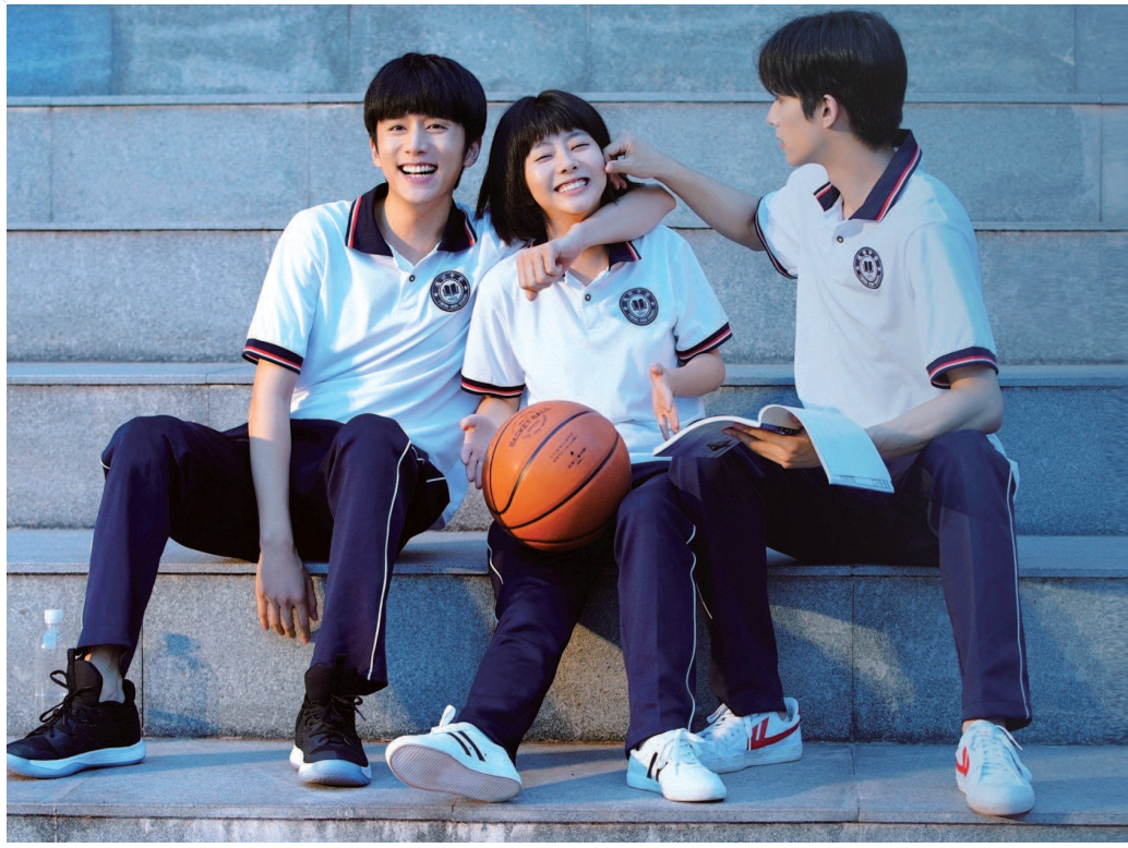
由紫金陈小说《长夜难明》改编的网剧《沉默的真相》剧照