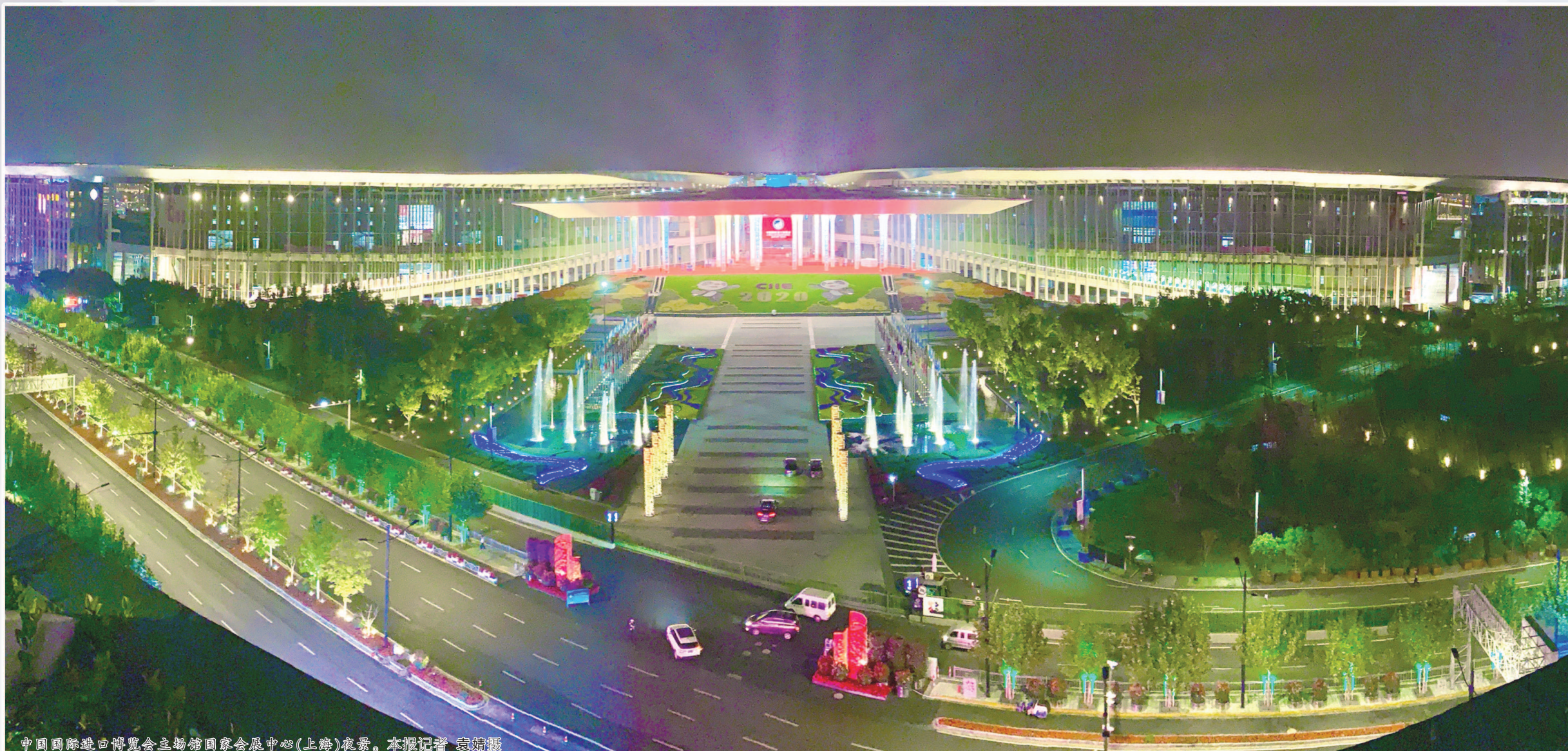
中国国际进口博览会主场馆国家会展中心(上海)夜景。