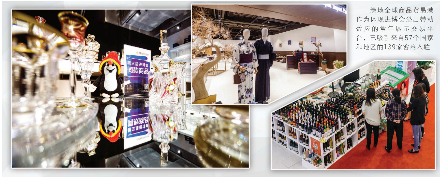
绿地全球商品贸易港作为体现进博会溢出带动效应的常年展示交易平台,已吸引来自57个国家和地区的139家客商入驻

“十一”长假,国家会展中心(上海)和中国国际进口博览会依然是一派忙碌的景象:招商部门正在紧锣密鼓地审核和处理数以万计的专业观众注册报名信息;招商部门忙着对接境外参展企业,统计第三届中国国际进口博览会展品信息填报、跟踪展位设计、展品运输情况;会议中心、设备工程、安全保卫等部门开展“手术刀”“啄木鸟”行动,排查重点区域安全隐患……这已经是第三个不休息的国庆假期了。今天,距第三届进博会开幕还有30天,城市服务保障工作进入最后冲刺期。16个保障组和进口博览局正进一步提升“安”与“防”、“好”和“精”水平,用一流“上海服务”确保展会成功举办。