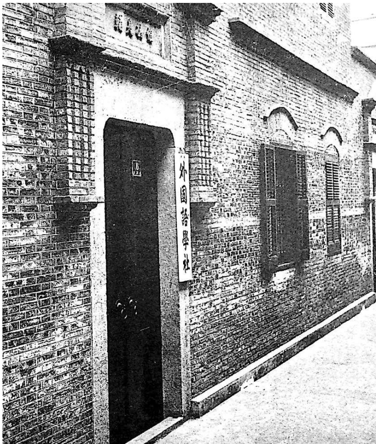
▲历史照片中的新渔阳里

“老渔阳里2号,参与并见证了《共产党宣言》首个中文全译本的校对和策划出版。”李斌介绍,不仅如此,陈望道还曾入住于此——1920年年底,陈独秀去广州,陈望道接任《新青年》主编。因工作需要,陈望道搬到老渔阳里2号楼下统厢房居住。在这座党的早期指挥部里,他独当一面,为党的发展和壮大作出了不可磨灭的历史贡献。