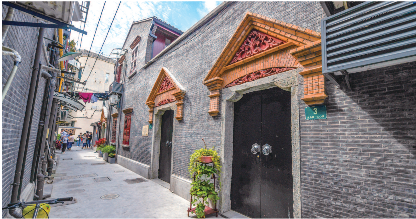
▲位于今天南昌路100弄2号的老渔阳里。

“在这片街区内,中国先进分子完成了精英聚集、理论宣传、阶级动员、人才培养、组织创建、筹建全国代表大会等工作,实可谓中国共产党、中国青年团的发源地和中国共产主义运动的策源地。”上海市中共党史学会渔阳里历史文化研究会会长、上海大学马克思主义学院李斌这样表示。