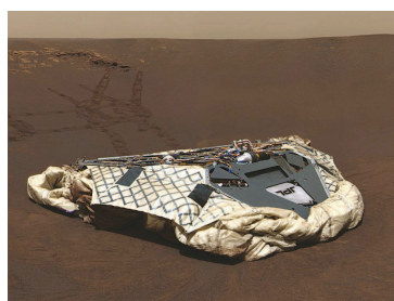
“机遇号”火星车在离开登陆点,开启宇宙马拉松之前,最后一次回望着陆器。

“探火”进入第二次热潮,截至今年6月,共进行了19次发射,主要以发展新技术和获得科学发现为目的。美国实施了庞大的“火星生命计划”,发射了不少新型火星探测器。欧洲航天局、印度也成功探测了火星。这一阶段的火星探测成功率大为增加。