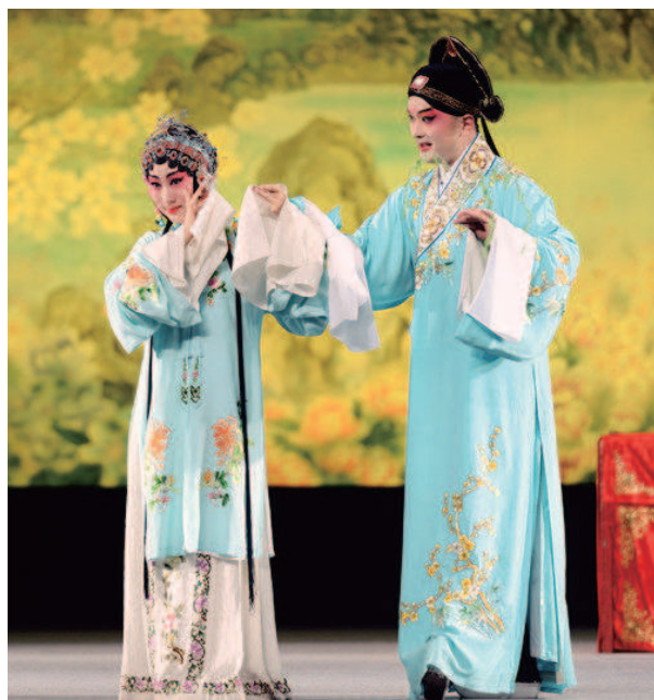
图为《牡丹亭》演出照。

本报讯（记者王筱丽）2020年正值汤显祖诞辰470周年，上海昆剧团将携全本《临川四梦》——《邯郸记》《紫钗记》《南柯梦记》《牡丹亭》于6月18日至21日亮相上海东方艺术中心。这不仅是这些作品首度在上海大剧院完整全本献演，也是东艺疫情后第一场公开售票的演出。