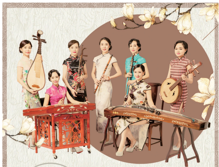
▲杭州歌舞剧院“西子国乐”乐团。

在双方看来，文化领域的长三角一体化要谋求更高质量发展，不但是要把艺术生产、艺术普及、演出经营统筹起来，让艺术精品“走出去”“引进来”，给长三角观众带来获得感和幸福感，更是希望借此机会壮大文化市场主体，提升长三角文化市场的整体实力和竞争力。