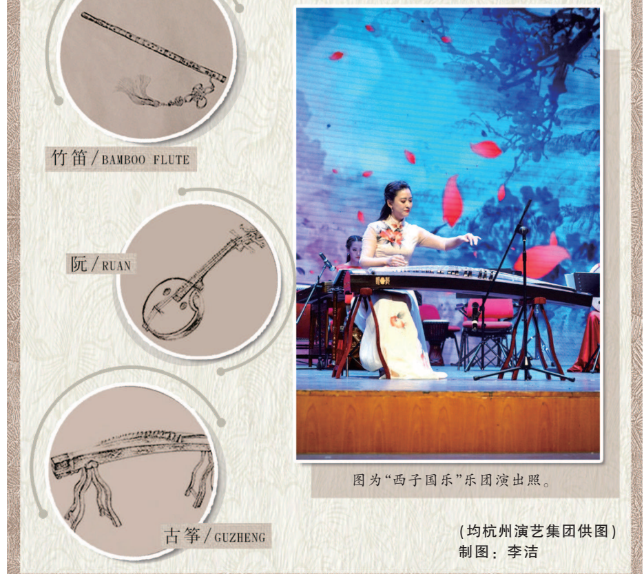
图为“西子国乐”乐团演出照。