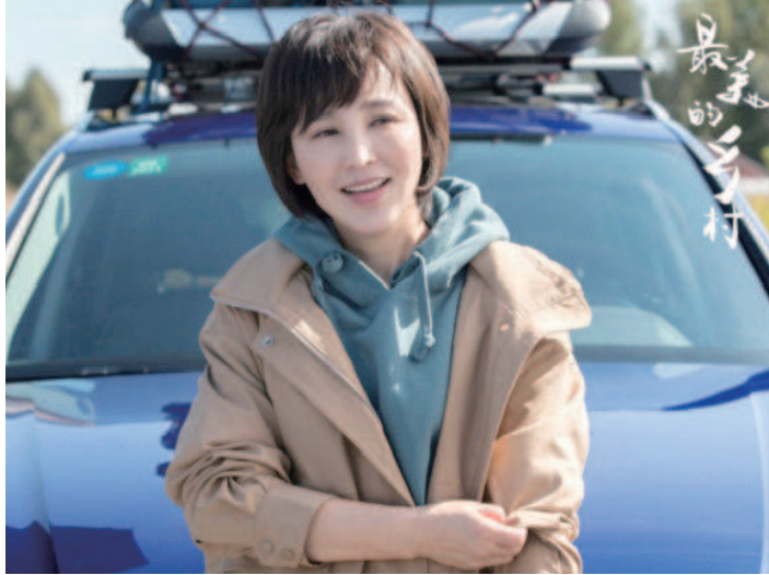
《最美的乡村》以独立单元剧的形式，讲述了三名共产党员扎根一线，助力脱贫攻坚，建设美丽乡村的故事。图为该剧剧照及海报。