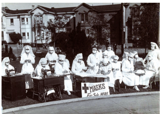
▲1918年流感肆虐期间人们在缝制口罩出售

《华尔街日报》撰写了一篇有关莫里斯的引人入胜的报道。报道称,莫里斯的雇主随后收到匿名警告,称其“财务安排极不寻常”。莫里斯被指控涉嫌挪用数百万美元公款来维持自己的奢华生活,他还被指控向客户提供非法回扣。2015年7月9日,他被传唤到华盛顿办公室与法律事务负责人会面。莫里斯意识到他遇到了麻烦,于是缩短了会面时间,然后迅速抽身离开。他买了一支枪,驱车前往他最喜欢的高尔夫球场,吃了一顿牛排晚餐,请大家喝了一轮酒。他走到离俱乐部几百码远的一个火山坑前,手里拿着一瓶昂贵的香槟,把自己人寿保险公司和理财规划师的详细信息