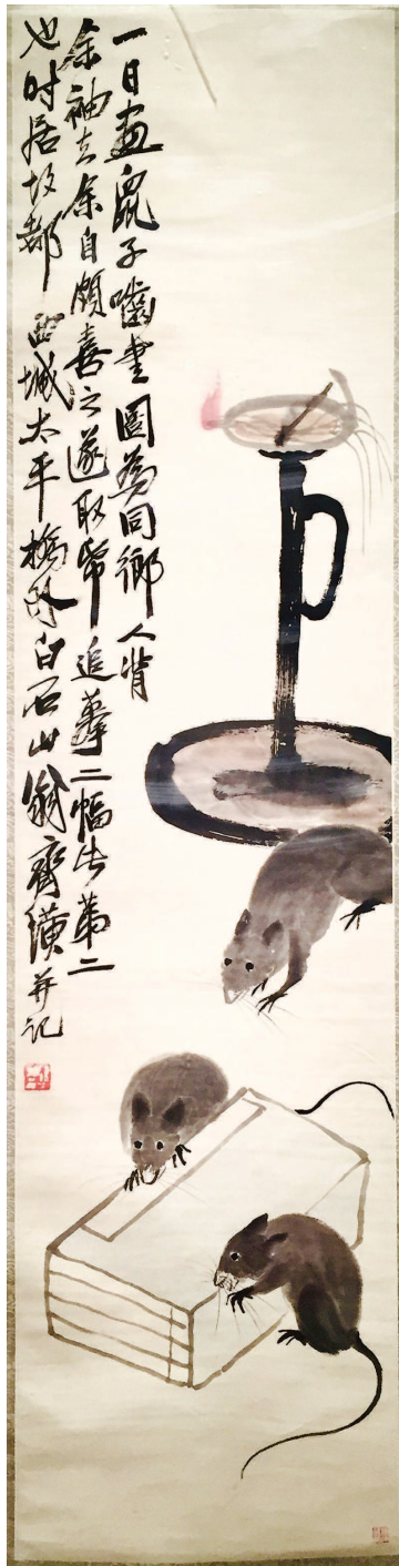
齐白石《灯台三鼠图》(1930)，现藏中国美术馆

山西太原北齐娄睿墓墓室上栏一周绘有十二生肖的壁画，正北为鼠，现仅残存嘴巴胡须部分。不独有偶，河北的湾漳北朝大墓、朔州北齐墓等的墓室中均见有十二生肖图，渐成系统。王倩认为，十二生肖合同四神、二十八宿构成宇宙世界，鼠处于正北，或与玄武相对。隋至初唐，以长安为主的北方地区多在墓志盖四边