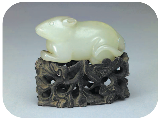
清·青白玉十二生肖之鼠，现藏北京故宫博物院

壶门内镌刻十二生肖。隋开皇七年(587)宋忻夫妇墓为较早的一座，志盖上的十二生肖与四神相配。然将四神放置四刹，鼠则位于正北子位。南方地区则比较流行塑十二生肖俑，以两湖地区为代表，形制有动物头顶、手持动物以及兽首人身，数种形式。在武汉地区多能见到这些形式，前者属隋文帝年间的武汉周湾大墓中的生肖俑，后