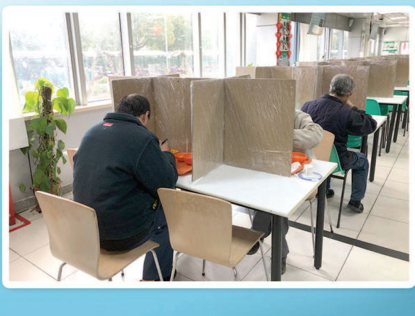
图③:食堂在每张餐桌上安置了交叉的隔离板,让员工在“格子间”内用餐。