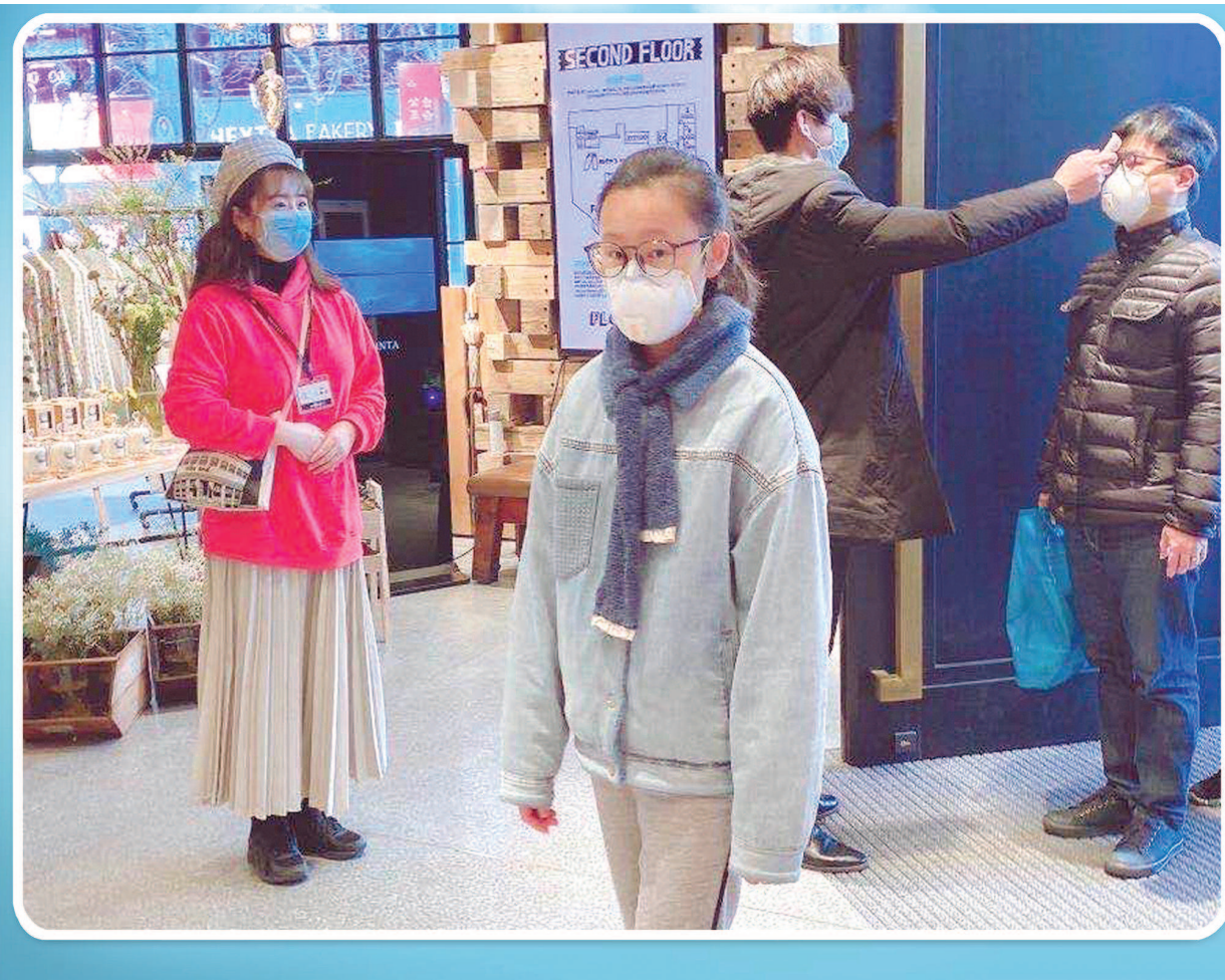
图①:顾客进入商场需排队接受测温。图②:超市在重点区域设置“一米线”引导消费者单进单出、安排专人巡场警示顾客注意安全。(均资料照片)图③:食堂在每张餐桌上安置了交叉的隔离板,让员工在“格子间”内用餐。