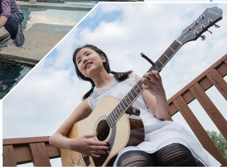
▼《零零后》记录了两名中国00后从幼儿到青年的成长经历，完成了一次对教育、成长的辩证思考。

漫效果、真人秀形式、悬疑剧视角、竞技比拼、Vlog等元素被纷纷运用进来，吸引了更多青年人的目光。从线上到线下的“强互动”体验同样在拓展。爆款纪录片《人生一串》开出的官方授权烧烤体验馆，成了青年人排队打卡的网红地标，甚至吸引不少异地观众专程赶来体验。