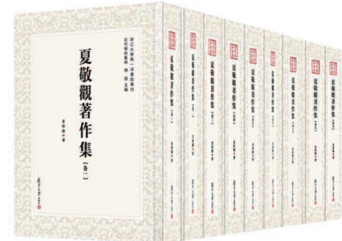
《夏敬观著作集》(全9卷)

多纪录片奖项的《四个春天》，便凭质朴的家庭影像打动了观众。纪录片展现了一对老年夫妇充实的晚年生活，老人在失去至亲后与生活握手言和的情节，感人至深。而纪录片背后的故事同样精彩：从2013年开始的四年里，导演陆庆屹拿着一只并不高端的照相机，跟拍父母多时。之后为了处理海量素材，他甚至花了两年时间自学剪辑。拍摄过程中最大的一笔投资仅是一架1500元的三脚架。同样用小火慢炖出岁月感动的，还有院线纪录片《零零后》。影片记录了两名中国00后从幼儿到青年的成长经历，90分钟的作品，背后是12年跟拍，以及300多小时的影像素材积累。作者在绵延的时间长河中打捞充满意味的日常细节，编织出个体生命蜿蜒的成长曲线，也完成了一次对教育、成长的辩证思考。