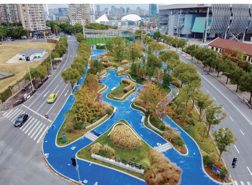
黄浦台地花园借鉴了欧洲经典台地园的造园要素。

本报讯（记者史博臻）500至5000平方米的街心花园，是最贴近市民的绿色空间。今年，上海有多处街心花园“上线”，按照“小”“多”“匀”的布局理念，在闹市区“见缝插绿”，颇为养眼。市绿化市容局昨天透露，到今年年底，全市已建成151个特色鲜明的街心花园。