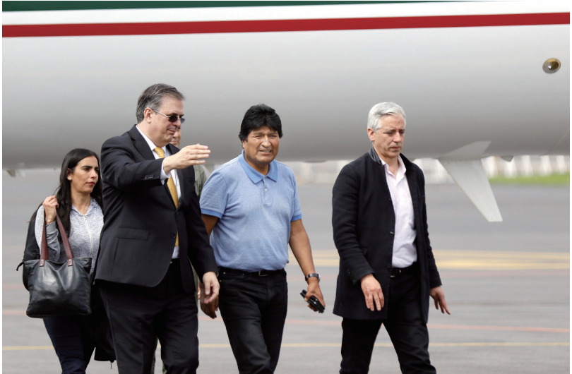
11月12日，莫拉莱斯（右二）抵达墨西哥城国际机场。

玻利维亚参议院第二副议长、反对派成员珍妮娜·阿涅斯12日宣布出任该国临时总统，表示将尽快重新进行总统选举。