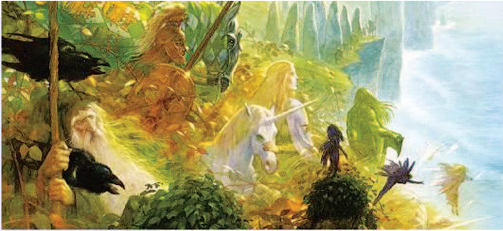
世界插画大师约翰·豪新书《中洲旅人》在上海书展期间首发。图为约翰·豪的画作

在这样的担当与追求下，上海人民出版社在主旋律出版、学术热点、大众文化等领域多线开花，为今年的上海书展和翘首以盼的读者们带来了逾 2000 种图书，包括作家刘统的《战上海》、德国作家哈贝马斯的新书《欧盟的危机：关于欧洲宪法的思考》、英国作家勒卡雷唯一的回忆录《鸽子隧道》等。