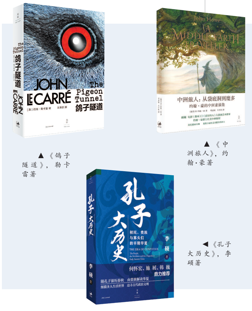
▲《鸽子隧道》，勒卡雷著

早稻田大学十二位教授与业界学者深度解读电影大师黑泽明影像世界的书籍《黑泽明之十二人狂想曲》，由早稻田大学岩本宪儿和武田濑这前后两任日本映像学会会长执笔，内容包括《罗生门》的音乐、《七武士》的常民构造、《野良犬》的都市影像、《白痴》的狂欢化、《续姿三四郎》中幽鬼的肖像、《乱》中的能与狂言、《梦》中的梵高、《八月狂想曲》中的生与死……该书被戛纳金棕榈奖得主是枝裕和导演推荐为母校早稻田大学电影课程。是枝裕和曾表示，“黑泽明是第一个我看过全部作品的导演。也是我 19 岁立志成电影以来，翻看并参考最多的”。