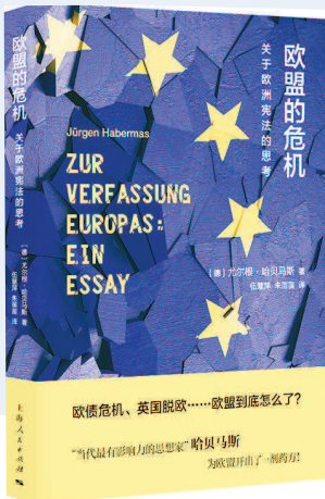
▼《欧盟的危机：关于欧洲宪法的思考》，哈贝马斯著

世界正进入重塑格局的新阶段，各国在国际关系层面的利益冲突相互交织，而推动构建人类命运共同体是世界发展的历史必然。为了让读者了解国际秩序的变化，增加中外良性互动，上海人民出版社推出了一系列相关新书。