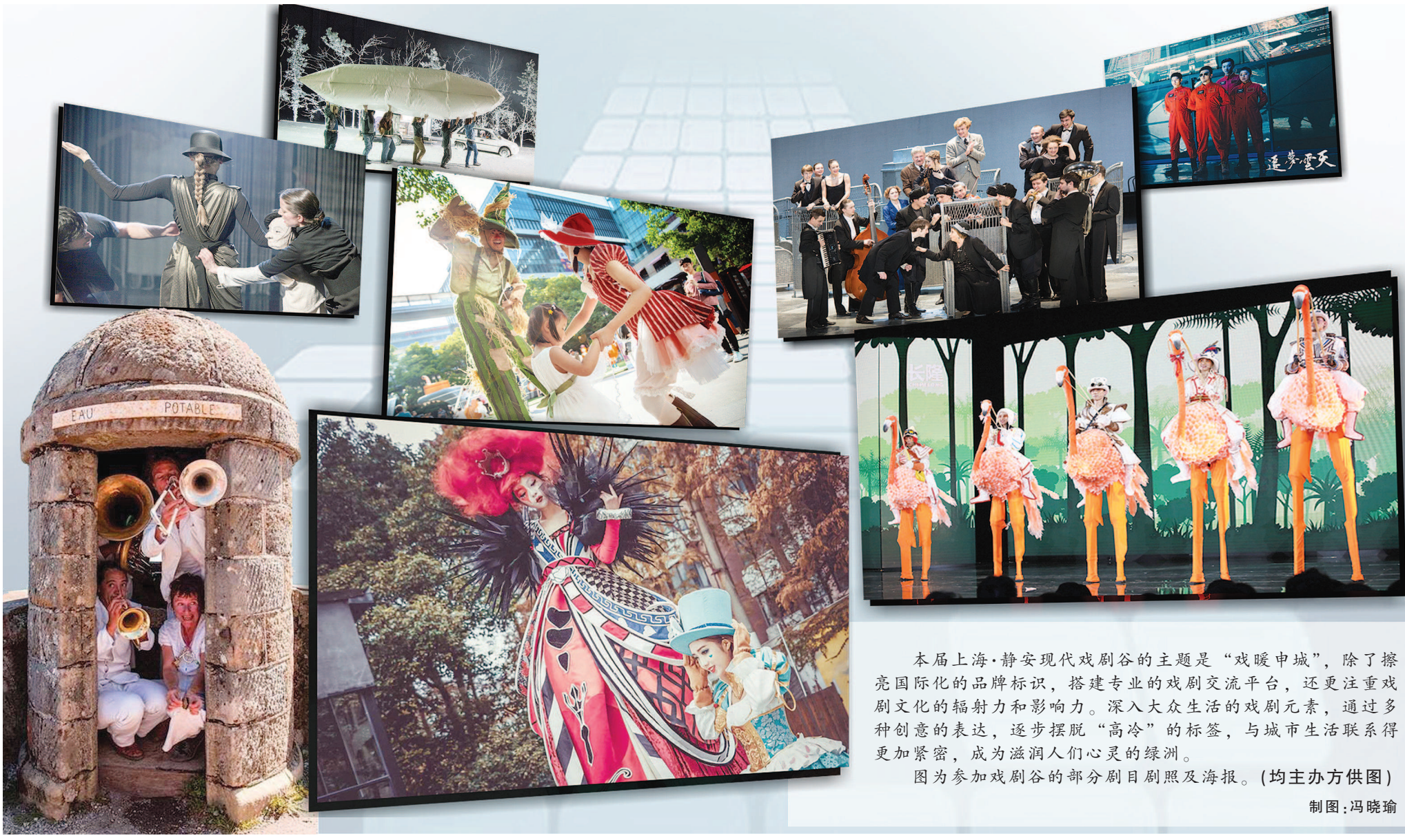
本届上海·静安现代戏剧谷的主题是“戏暖申城”，除了擦亮国际化的品牌标识，搭建专业的戏剧交流平台，还更注重戏剧文化的辐射力和影响力。深入大众生活的戏剧元素，通过多种创意的表达，逐步摆脱“高冷”的标签，与城市生活联系得更加紧密，成为滋润人们心灵的绿洲。