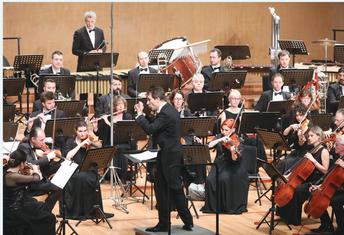
塞尔维亚广播交响乐团在指挥博洋·苏季奇率领下,演绎中国原创新作。