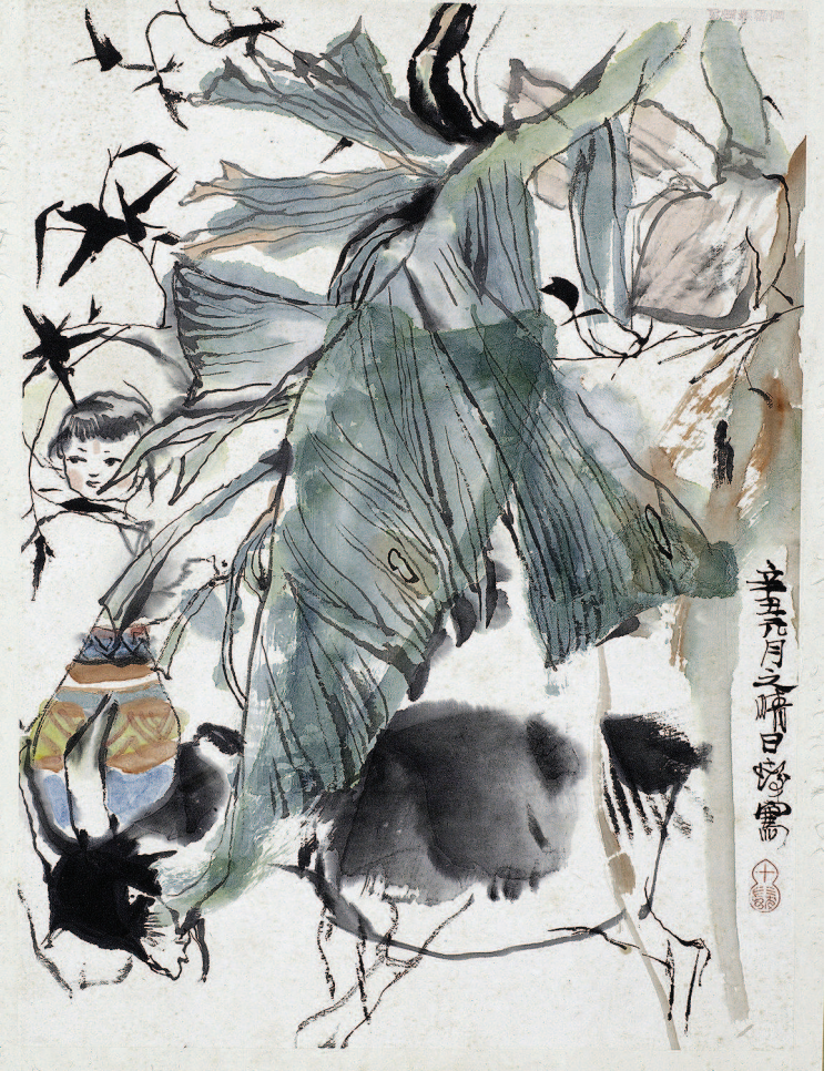
程十发创作于1961年的《芭蕉少女》。

在漫长的艺术生涯中,程十发的人物画并非一成不变。此次展览的一组程十发牧童画中,就藏着变化的端倪。上世纪五六十年代,程十发笔下的牧童有着对于局部的细微呈现,比如画牧童的眼睛,用细线勾出,眼珠眼白分明,显得天真而聪慧。而七十年代以后,程十发笔下的牧童更简也更趋韵味,笔下牧童的眼睛只剩漆漆的两点,稚拙也更精神。减笔,可谓“程家样”风格形成的重要轨迹之一。“减笔而意不减,且当减者减,不能减者则不必减,笔简而神全,此不易求得之境。”这是程十发理解的“减笔”。同为海派画家的张培成指出: