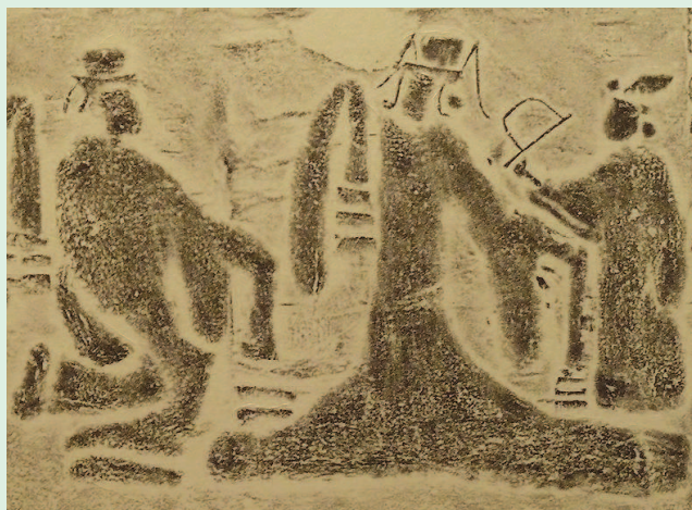
图5 四川彭州太平乡出土汉画像石局部(拓片)