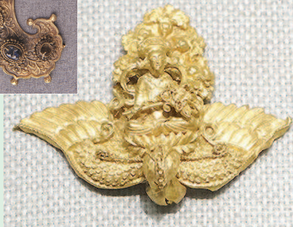
→ 图8 西王母骑凤金簪 湖北恩施猫儿堡出土