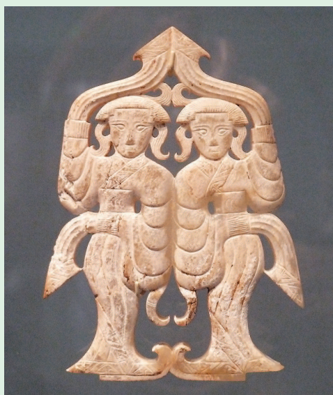
图2 战国玉饰 华盛顿弗利尔美术馆藏