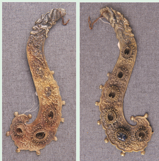
↑ 图7 凤冠上的博鬓之一 遵义播州杨氏土司家族墓出土