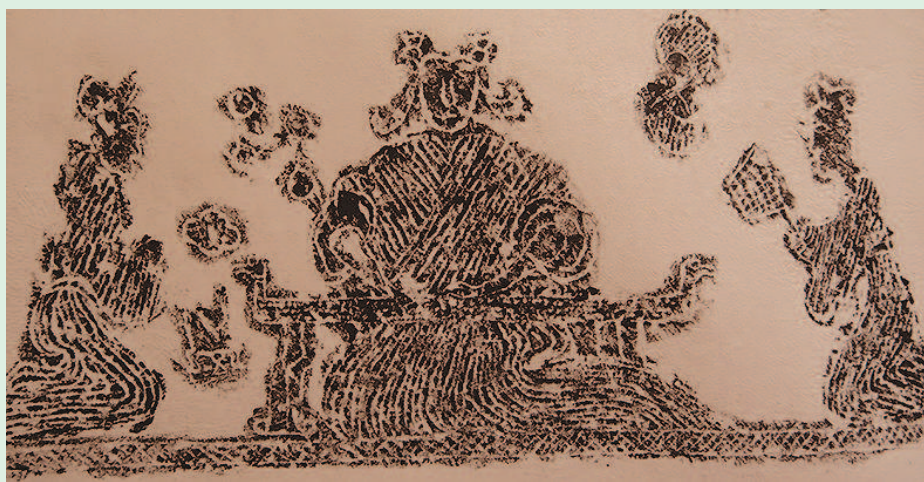
图4 邹城市文物局藏汉画像石局部(拓片)