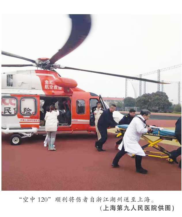
“空中120”顺利将伤者自浙江湖州送至上海。

本报见习记者唐闻佳 通讯员徐英 长三角一体化在医疗领域已给患者带来切实的获得感，长三角空中救援网再添成功案例：3月6日下午，一名不慎从九楼坠落的33岁男孩经“空中120”顺利自浙江湖州送至上海，上海第九人民医院对接救援，当晚紧急手术。记者昨天从医院获悉，孩子手术后进入重症监护室观察，目前病情稳定。