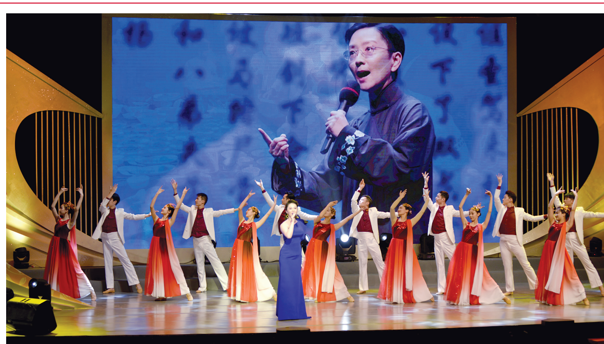
昨天下午，以“奋进新时代 筑梦新天地”为主题的上海市纪念三八国际妇女节109周年大会在上海商城四楼商城剧院举行。