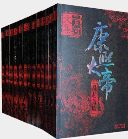
“帝王系列”合集。

二月河因其笔下500万字的“帝王系列”,《康熙大帝》《雍正皇帝》《乾隆皇帝》三部作品,被海内外读者所熟知。近二十年间,他几乎以一年一卷30万字的速度,将康、雍、乾三朝的历史与零星呈现给读者