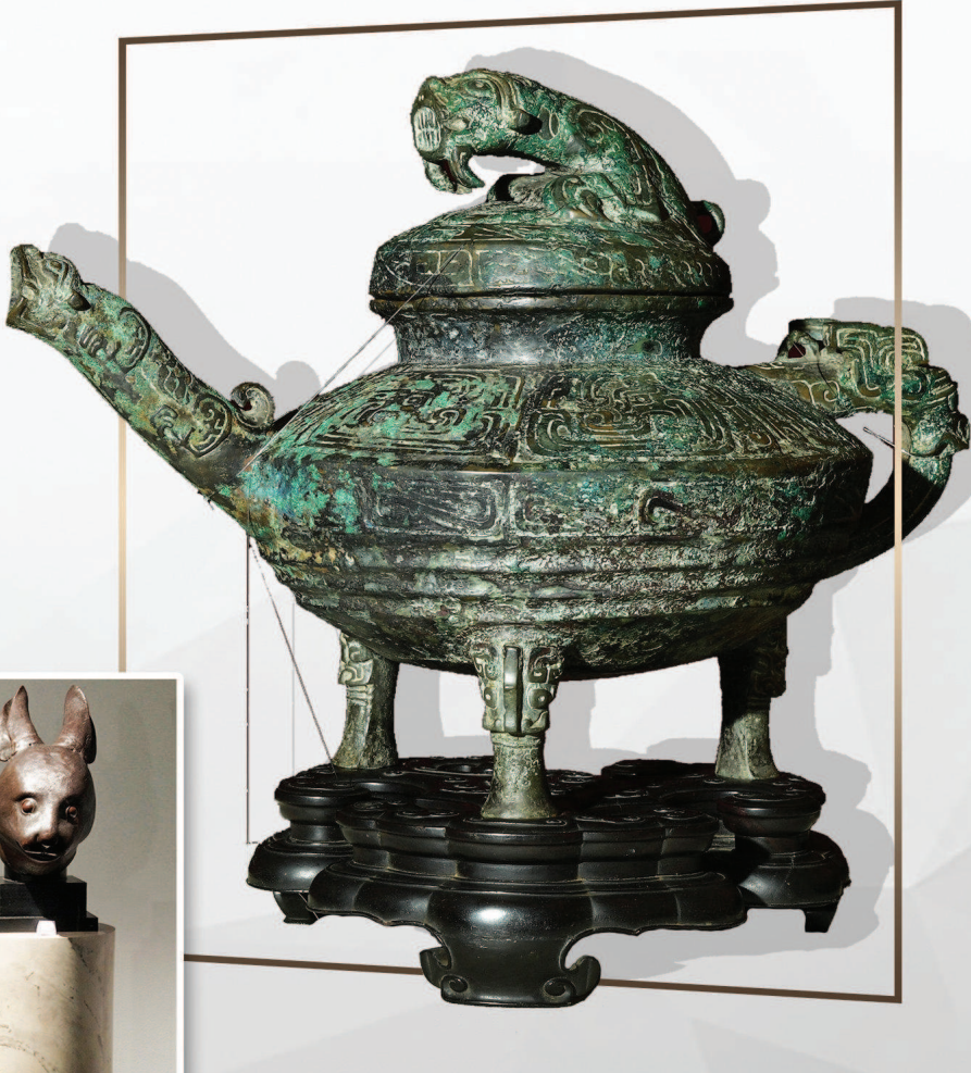
▲青铜“虎鎣”。 ▼鼠首与兔首铜像。（均资料图片） 制图：李洁