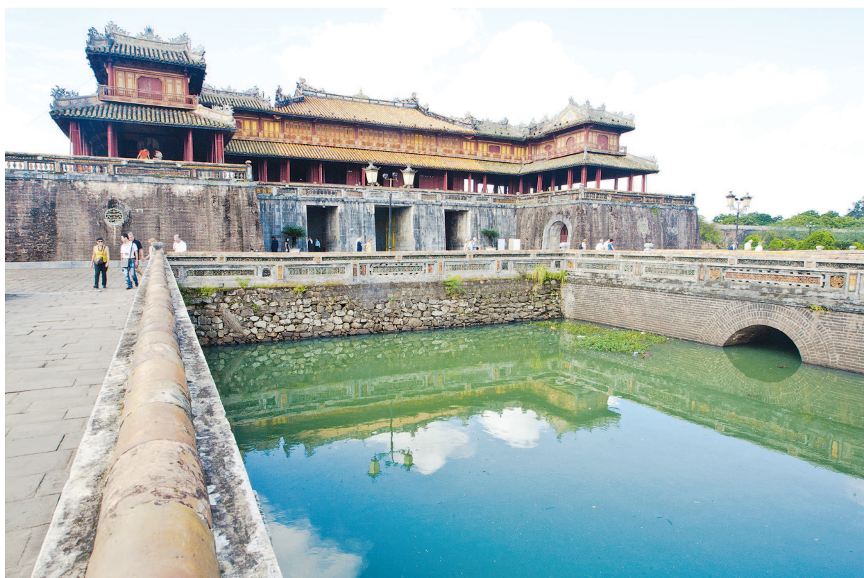
具有中国古代建筑特点的越南顺化皇城，也是世界文化遗产。

第二天运气真不错，居然雨歇。早餐后，司机准时抵达，一日行程开始。一路上景色很美，梯田绿油油的，白云盘旋在半山腰，远处的海和海岸在海山公路上清晰可见。途中有两三次停车拍照，感觉一下子远离了摩托车轰鸣的城市，视野开阔起来，尤其是途径顺化城市时，看到新城市的崛起，到处是国际顶级连锁酒店，以及高档别墅与公寓大楼，这是几天来看到的最新摩登色彩的城市。在顺化附近还有一座大理石山（Marble Mountain），进入山中洞穴，感觉就像到了巴马天坑。上天入地的感受形象逼真，洞中向上攀爬能俯瞰远处的顺化港，而往下深入洞穴，到处是地狱群像。 会安古城面积不大，是一处世界文化遗产。行走城中，看到不少中国南方传统特色，包括宗祠、手工艺品等，集市的大排档精彩纷呈，我们安坐其中，品尝了当地美食，同时体验了越南各个食肆的奇妙感受。放眼望去，鲜少中国游客，大多是欧美和日韩的，可能这座古城在国内的宣传力度还不够。