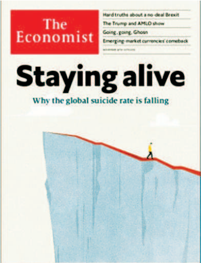
《经济学人》11月24日 全球自杀率在下降

“我爱美国，这就是我为什么要讲述它的真相。”本期封面故事的作者是一位出生在越南，成长在美国的美国人。他的生活与两场战争密不可分：越南抗法战争和越南战争。许多美国人认为对越南的战争是出于善意的，但他表示，越南战争实际上是法国殖民主义的延续，是美国帝国长达数百年扩张的一种表现。美国的扩张从殖民地时代开始，一直延续至今。