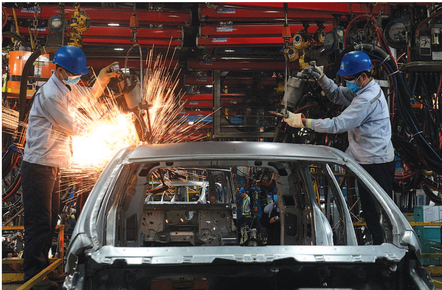
在福特汽车越南工厂，工人们正在流水线上作业。随着经济发展，越南的制造业也在不断升级。

除了中国的“双十一”影响越来越大外，越南也有自己的网购节——“周五在线”（Online Friday）。自2014年开始，在越南工贸部的推动下，越南电商平台在每年12月的第一个星期五组织“周五在线”活动，消费者当天在网上购物将享受折扣、免邮费等优惠。2016年“周五在线”