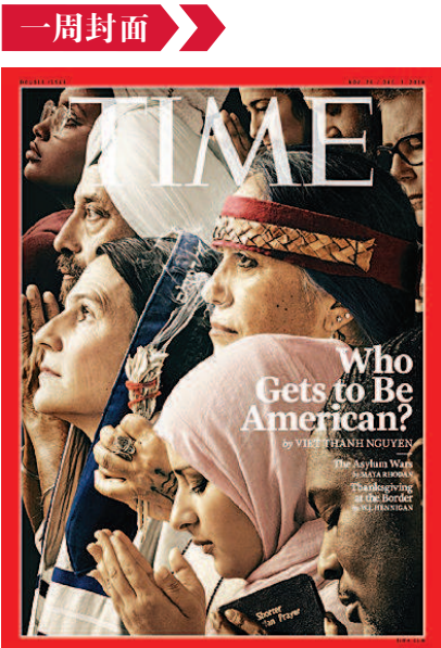
《时代》11月26日 美国的扩张

联，无不表达着国千岁人万年的期望，现在读来，实在是大反讽的景象了。也许是我的生活境遇和阅历限制了自己的理解力，至少，我的反应是更倾向于“是非成败转头空”，浮华绚烂一瞬间的唏嘘。 这一趟皇城寺庙的旅行丰富了我不少的眼界，原来，pagoda（英文字面意思是“塔”）和temple（英文字面意思是“庙”）在越南是有差异的，前者是朝拜佛或神明之处，而后者是祭拜先祖（即真实人物）之所。在天姥寺，和尚的作息时间是凌晨三点半起床敲响晨钟，经过一日参禅、劳作等修炼后，晚九点半入睡。计算一下，一共六个小时，是十分艰苦隐忍、清心寡欲的生活。此时我突然冒出一个颇有些不合时宜的念头：几日来我每日写旅行随笔，算下来睡眠六小时不到，也是辛苦；此外，如果我也按此例生活，略加调整，比如晚十点半洗澡睡下，早五点起床，那么能够静心而不受干扰的有效时间或许会更多，可以进行写作、瑜伽等，不是吗？