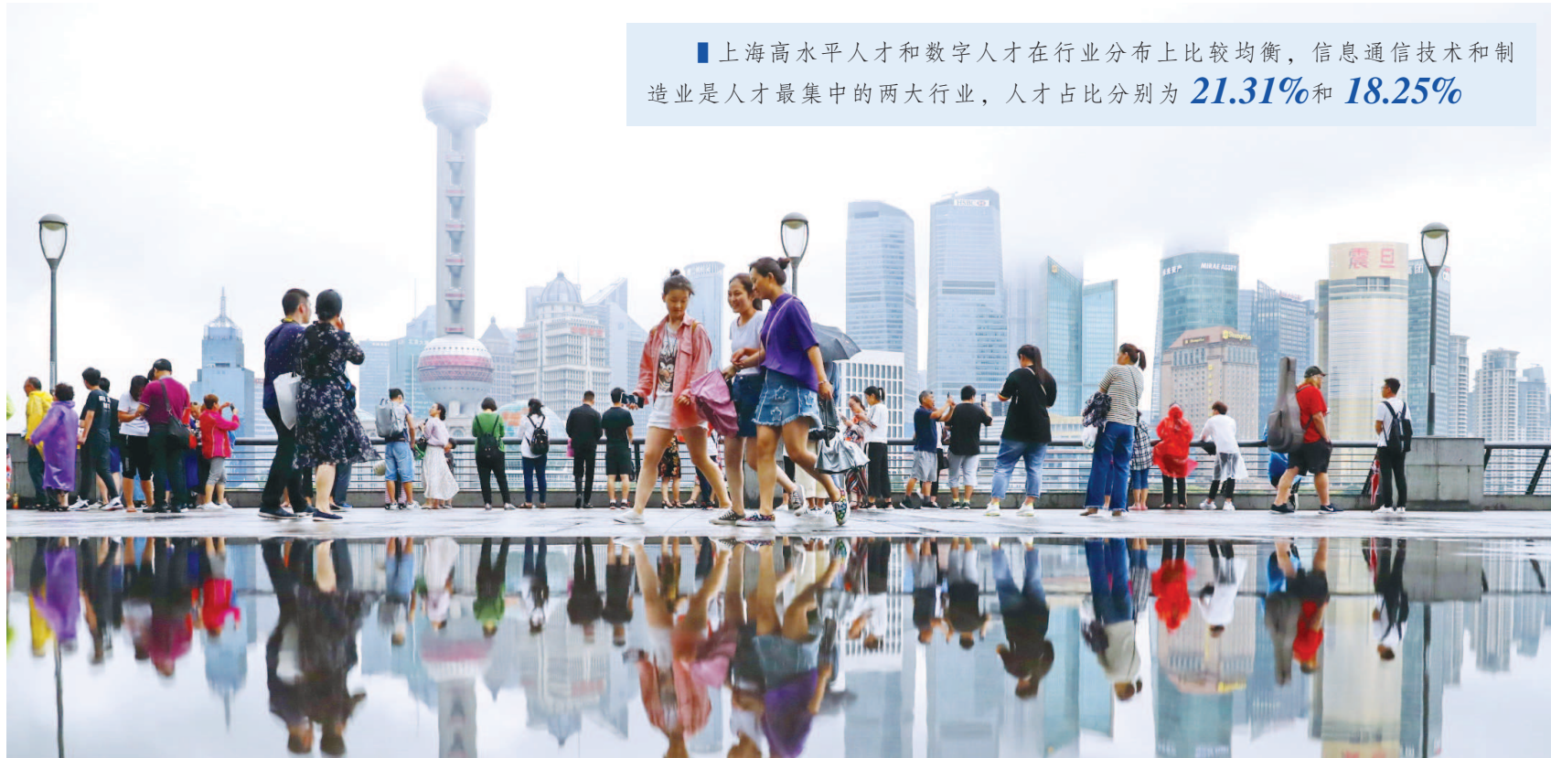
上海不仅能培育数字人才,还善于输出数字人才,这使得长三角在上海的带领下,形成各具特色、区域协同的特点。

而随着上海制造业比重的下降,服务性产业的人才需求不断增多,各类服务性人才今后将受到这座城市的青睐。当然,服务性人才不仅仅是指金融、法律等专业性服务人才,基于教育、健康等生活服务类人才也能在上海找到广阔发展空间。