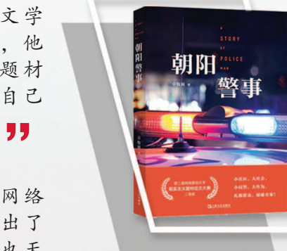
《朝阳警事》卓牧闲著

聚焦乡村支教、精准扶贫等社会热点,以主人公明月的成长历程为主线,突出刻画了士兵关山、郭校长以及一群为贫困山区的发展出谋划策的共产党员和企业家形象。