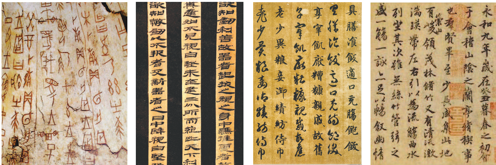
五类主要书体的演变(从左至右):篆书,殷商《涂朱狩猎牛骨刻辞》(正面局部);隶书,西汉《居延汉简》(局部);草书(左侧)和楷书,智永《真草千字文》(局部);行书,王羲之《兰亭序》(局部)