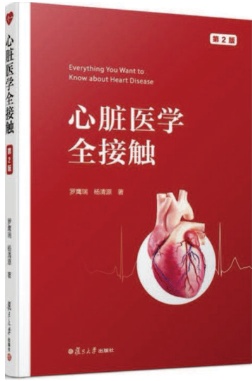
《心脏医学全接触》(第2版) 罗鹰瑞、杨清源著 复旦大学出版社出版

世界家庭医学组织候任主席(2016–2018)、前香港医学专科学院主席李国栋医生评价该书:再版“涵盖了最新及更完整的参考数据,包含实用的内容,可读性