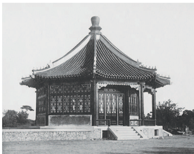
未名湖上最著名的景点之一——岛亭