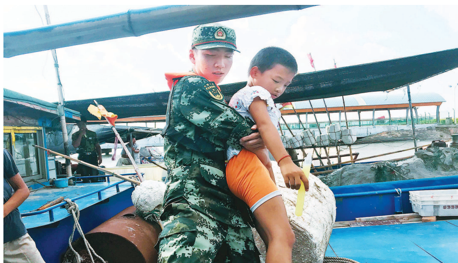
昨天,横沙港边防派出所警官帮助转移渔民和孩子。