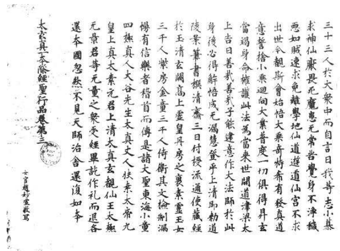
冲虚观王宗妙仙入京第一回经末 還身政命為寫此經

金仙公主四十多岁便去世了,玉真公主活到了七十多岁,她跟玄宗大概相距一两个月离世。玉真公主常常作为玄宗的宗教特使出访各地,举行各种宗教活动,推荐佛道名士。她推荐了好几位著名的佛教法师到京城的佛寺,并将他们引荐给玄宗。很重要的一点是,玉真公主推荐了李白入宫任翰林学士,这是郁贤皓教授考证出来的,以前大家都把“因持盈法师荐”忽略了,因为唐书李白传里说李白是吴筠推荐的,“持盈”实际上是玉真公主的法号,所以郁贤皓先生考证得非常准