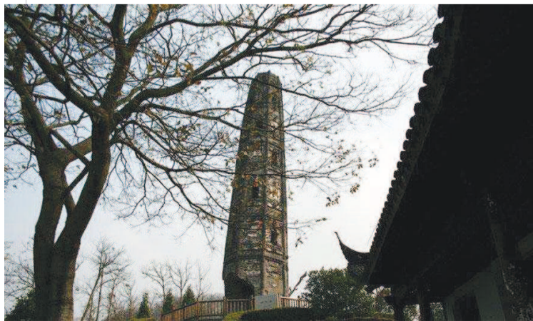
上海松江天马山护珠塔。年近六十的屠隆,邀请被罢官的冯祭酒,游览曾经自己的治下松江府的天马山。