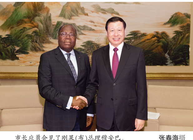
市长应勇会见了刚果(布)总理穆安巴。 本报讯 上海市市长应勇昨天会见了来沪出席第五届中非民间论坛的刚果(布)总理穆安巴一行,代表上海市政府和上海人民对总理阁下访沪表示热烈欢迎。 下转第三版