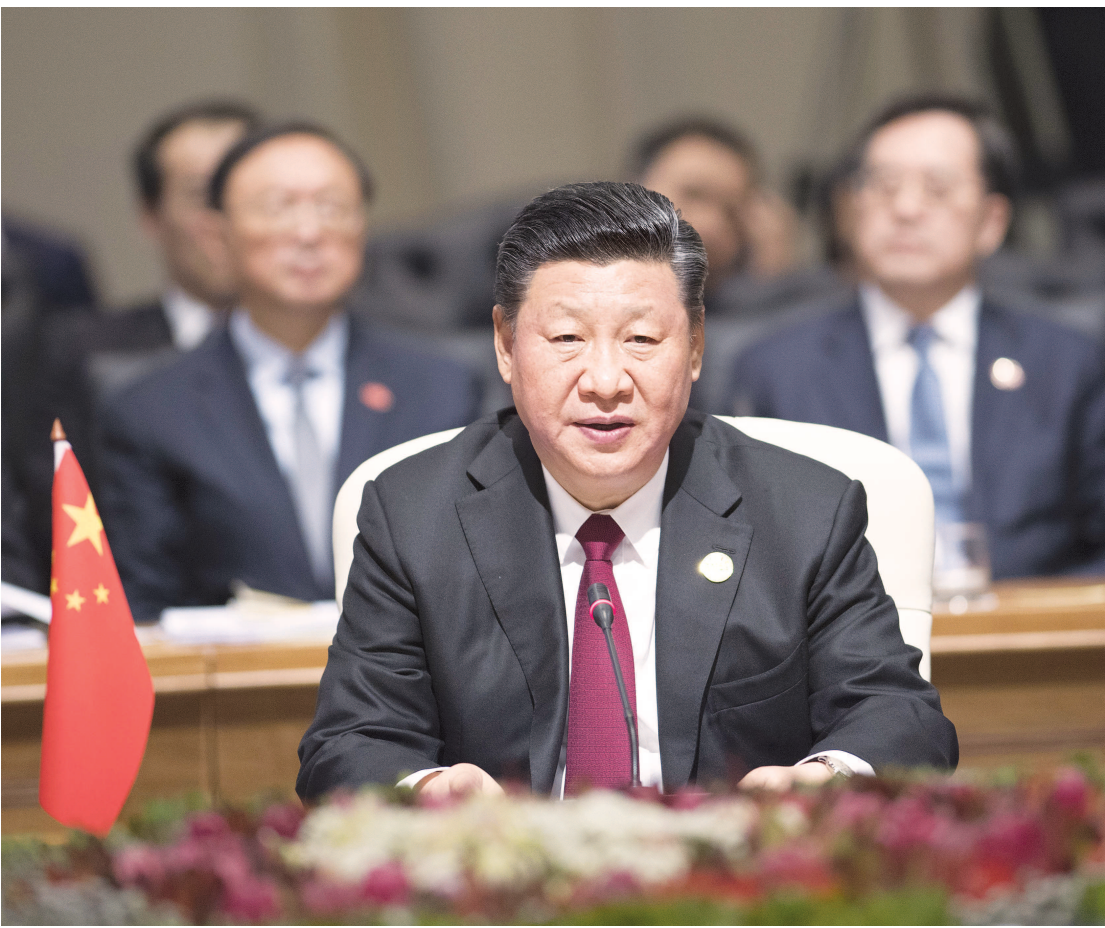
7月26日,金砖国家领导人第十次会晤在南非约翰内斯堡举行。习近平发表题为《让美好愿景变为现实》的重要讲话。