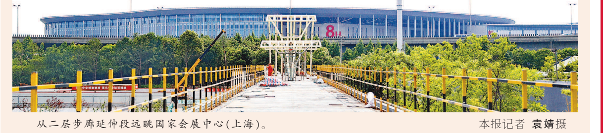
从二层步廊延伸段远眺国家会展中心(上海)。