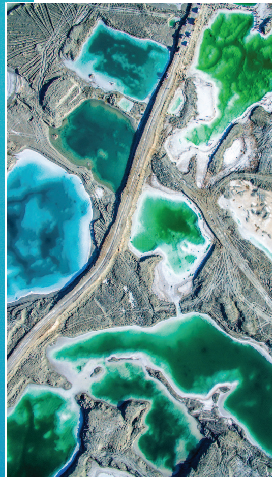
青海 柴达木翡翠湖