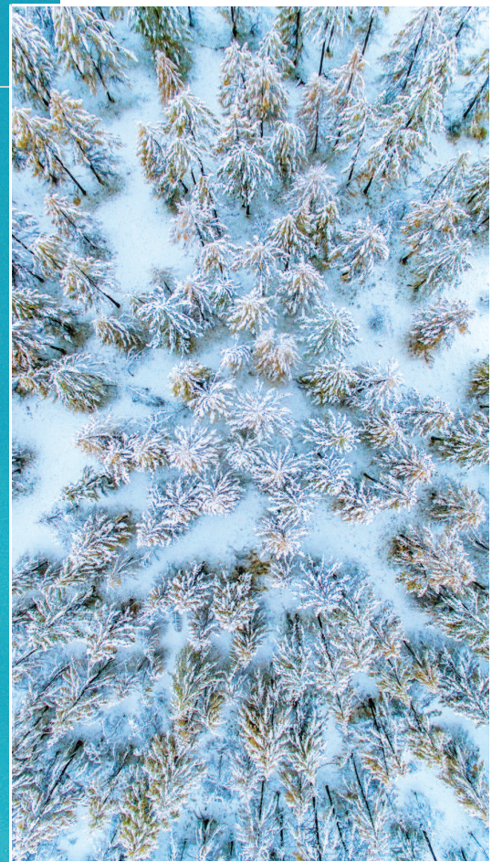
新疆 喀纳斯秋日雪景