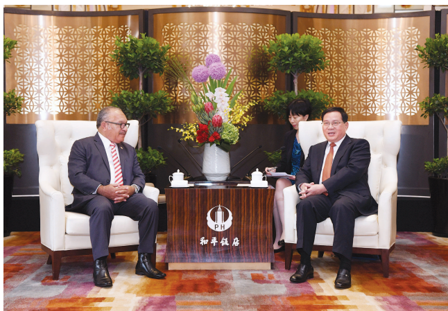
李强会见巴布亚新几内亚总理奥尼尔。