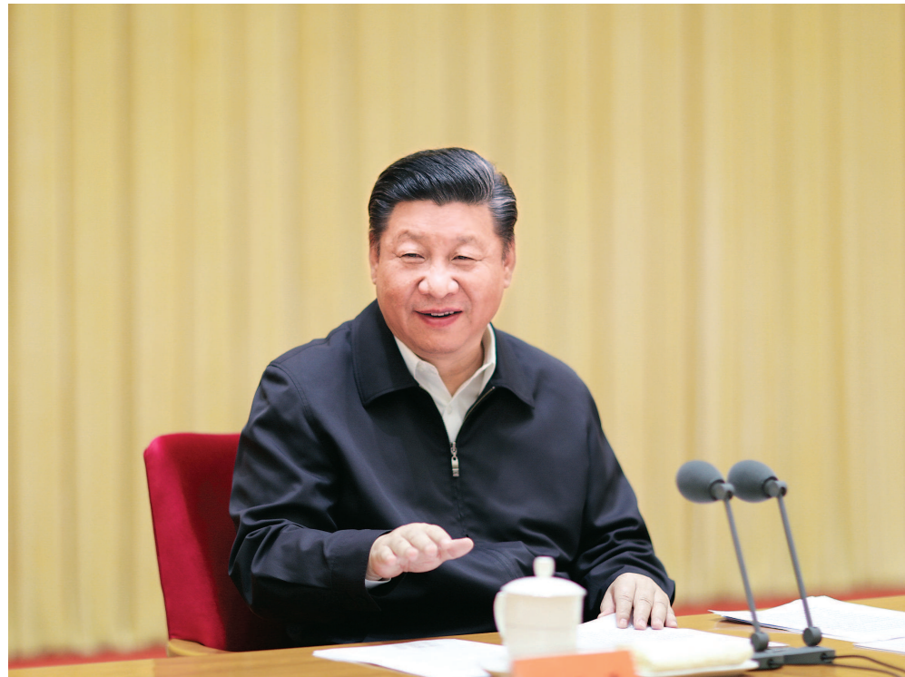
习近平在中央外事工作会议上发表重要讲话。