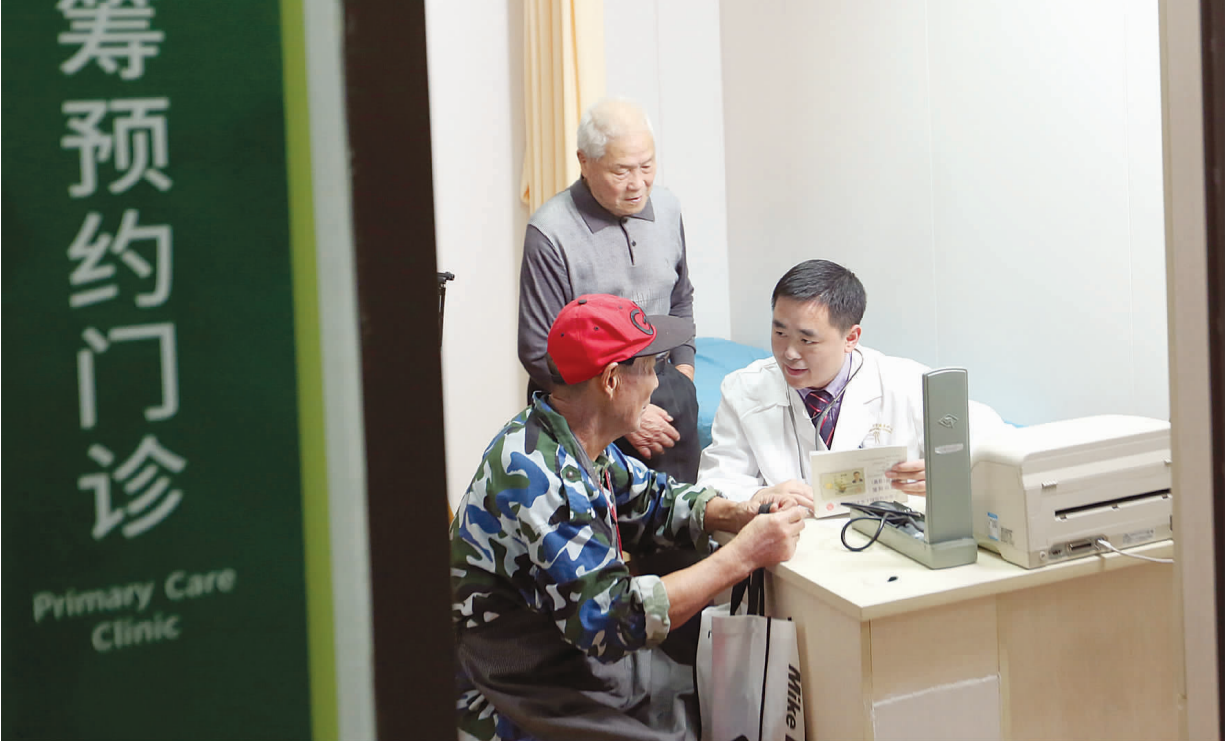
社区卫生服务中心全科医生正在上海市浦东医院全科统筹门诊为病人看诊。

多学科联合让原本因辗转奔波而延误最佳救治时机的患者有了最好的预后。浦东医院一方面与复旦大学附属华山医院、肿瘤医院等组成神经外科、乳腺外科多个专科医联体，另一方面又与同在浦东新区的上海交通大学医学院附属仁济医院、儿童医学中心等建立合作机制，疑难重症患者在救治上有了绿色通道，转入三级医院也更加便捷。