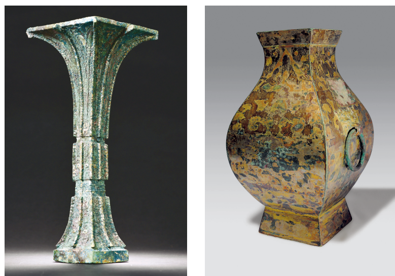
左图：商代晚期的兽面纹方觚。右图：信成侯鎏金方壶。