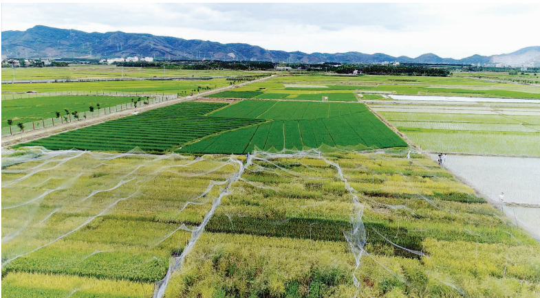
海南南繁基地中的海水稻田。