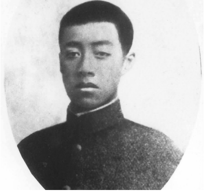
林觉民像。