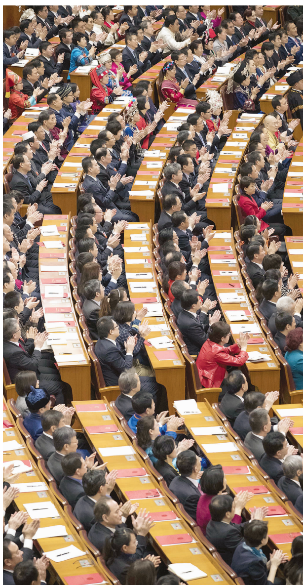
3月20日，第十三届全国人民代表大会第一次会议在北京人民大会堂举行闭幕会。