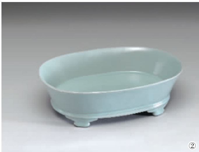
台北故宫博物院藏北宋汝窑青瓷水仙盆