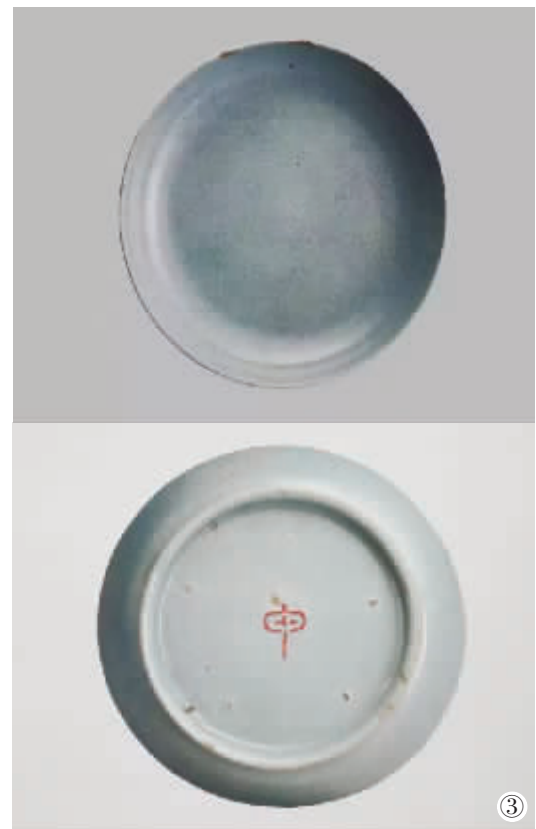
台北故宫博物院藏北宋汝窑青瓷盘(正反面)