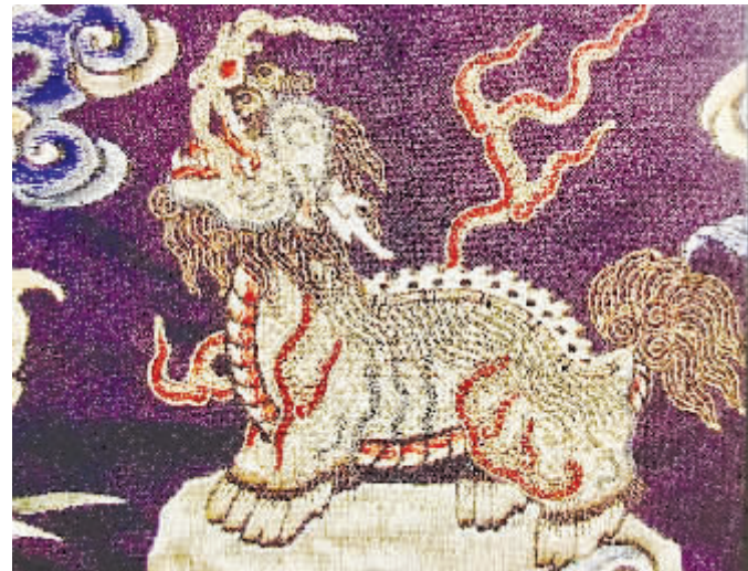
监察官员官服上的獬豸图案

唐代监察制度发展到一个新高度，唐玄宗时期正式确立一台三院（御史台、台院、殿院、察院）体制。台院、殿院与察院三院相互配合各司其职，发挥了有效的监察作用。言谏制度进一步发展，有唐一代直谏名