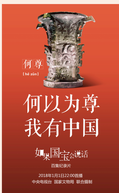
何以为尊 我有中国

以往大型百货公司跨年促销时，消费者在享受价格优惠的同时，往往不得不遭遇排队长队、停车难、人挤人等“痛点”。以服务升级来为顾客“排忧解难”是今年第一八佰伴营销的重中之重，他们在以往“当季标识明示”