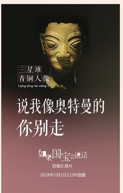
三星堆青铜人头像 说我像奥特曼的你别走

现藏于中国国家博物馆，为新石器时代晚期仰韶文化产物。该鼎采用伫足站立的健硕雄鹰造型，鼎口设置于背部与两翼之间，紧密贴合似背抱状，将鼎形器物特征与鹰的动物美感巧妙地融为一体。雄鹰眼圆睁，喙部呈钩状，结构简洁，威武雄壮，极具生命力。出土时发现，陶鹰鼎与骨匕、石圭等不少作为礼器使用的物件一同放置于墓内，可能与当时的祭祀活动有关。