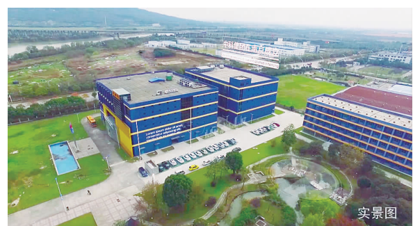
南京市江宁区中科路8号中科药业厂房

中科健康产业集团股份有限公司成立于1984年，它的前身是中国科学院南京分院下属院所的一个全民所有制科技发展公司。遵循中国科学院多次所属企业的改制，于2001年1月10日完成体制改革成为一个股份制集团公司。它的股东是中科院下属院所(代表中科院国有资产)及其科技人员、管理人员，现在集团注册资金已达2亿多元。中科依托强大的科研背景，30多年奋发图强、蓬勃发展，成为国内首屈一指的中药现代化、中药全球化的中药保健品企业之一。