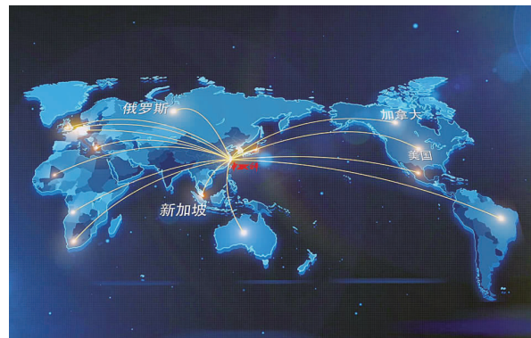
中科产品国内外销售网络

中科灵芝孢子油在新加坡被批准为中成药，大量应用于康复患者，深受专家和患者好评，并荣获2017年香港最受医护人员欢迎品牌“健康品牌大奖”。