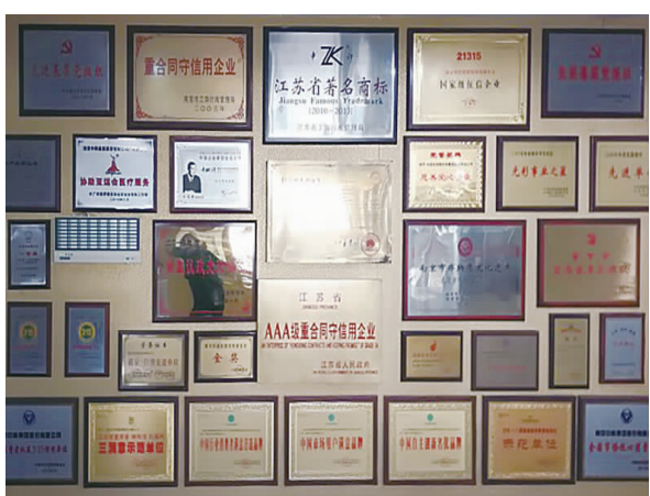
中科历年质量奖牌墙(局部)

中科及中科系列产品荣获了第十四届全国发明展览会金奖、中国著名品牌、诚信双优品牌、江苏省著名商标、连续18年参加中国国际高新技术成果交易会，并多次获得“优秀产品奖”、首届灵芝产品博览会金奖、优秀专利新产品一等奖、信誉保证产品、江苏省重质量、讲诚信、创品牌三满意示范单位、国家级征信企业、2017年香港最受医护人员欢迎品牌“健康品牌大奖”，2017年度3·15创建诚信经营放心消费单位等。