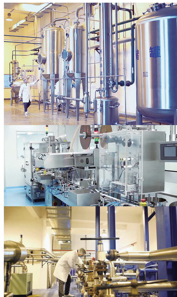
自动化在线检测，透明生产开放参观

现代常温恒温物理破壁技术，灵芝孢子破壁率高达99%，趋近全破壁。中科研发团队凭借自主研发的国家发明专利技术CO 2 超临界萃取技术(专利名称：一种灵芝孢子的超临界加工方法，专利号：ZL99123952.0)成功研制出全面流通世界的灵芝孢子油——中科灵芝孢子油软胶囊。建立全球首屈一指的灵芝孢子油CO 2 超临界萃取中心，并建立灵芝孢子油质量控制标准，灵芝孢子油指纹图谱技术等。