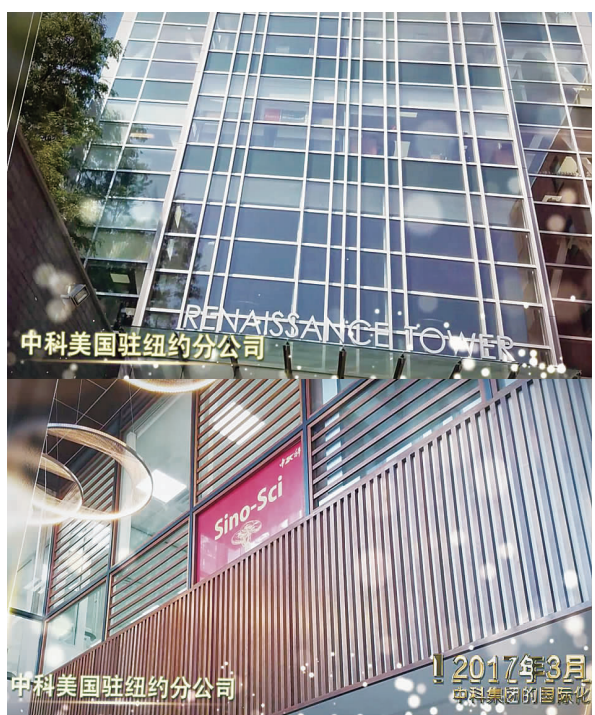
2017年3月 中科美国驻纽约分公司

2017年3月，中科美国驻纽约新公司正式成立投入运营，9月27日，中科精彩亮相美国最大的医药及保健品原料专业展览会2017 SupplySide West 展览会。