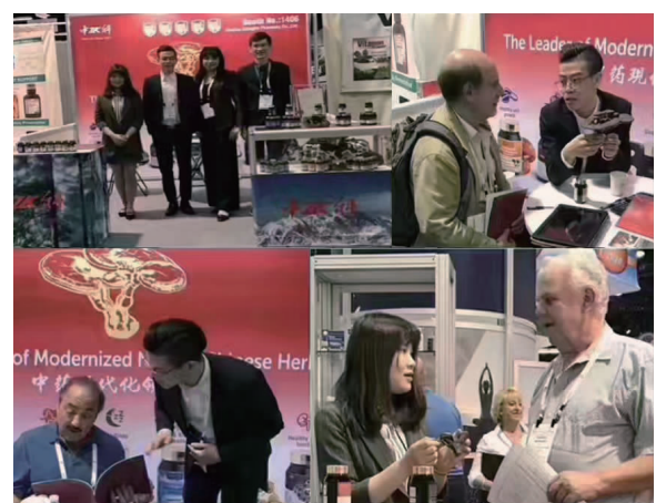
2017 美国 SupplySide West 展览会现场