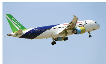
第二架国产大型客机C919在上海浦东国际机场起飞。