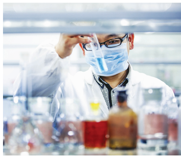
入驻东方美谷的上海莱士血液制品股份有限公司,是国内少数能够出口血液制品的生产企业。图为实验室里研究员正在进行实验。