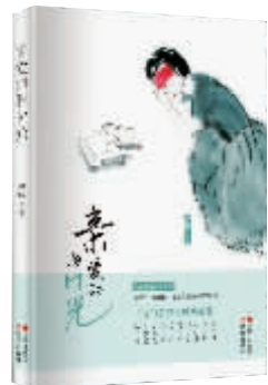
《亲爱的旧时光》 徐珏著 现代出版社2017年10月版

来说,这种偏爱深达肌肤下的毛细血管。在其笔下,挚爱的亲情与令人痛彻的爱情往往纠葛在一起,《绝响》中三叔的长相执手,《葵花》中小舅的自伤,《春天的最后影像》中八旬佝偻老太的枯坐,皆让人动容,让人不觉伤情。平静的生活川流之下,隐藏着一个一个具象的伤口,只有距离最近者,方知其压在胸口的重量。这一类作品,徐珏写了不少,正所谓“每到春来,惆怅还依旧”,而惆怅的气息是由作品中大量出现的悼亡主题铺就的。或者说,有一种悼亡的情结隐含于其系列作品中,亲人、老师、几成废墟的出生之地,皆成为悼念的对象,而与这些对象紧密相关的则是那些特殊的意象:作为乐器的埙、作为已逝爱人表征的葵花、作为苍茫往事象征的青瓦,等等,如同归有光笔下的枇杷树一般,伫立于具