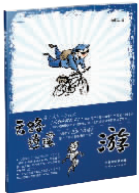
《云路逍遥游》 李昆武绘 云南人民出版社2017年6月版

在《云路逍遥游》前言里,他说:“云南有一百二十多个县,我去过其中一百一十多个……我不是