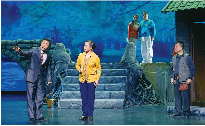
彩调剧《空村》聚焦当代农村，展现当代农村发生的变化。

在谈及对现代诗的看法时，他也直言不讳。他说，很多人正在把一些传统作品束之高阁，包括诗在内的古典文学、骈文面临着极大的危机。特别是流行中文夹杂外文的表达，余光中将这种情况称作“洋炖”。他说自己一生写诗的滋养来自于《诗经》，但是到了今天，情况不同了，这就好比一个比喻：“当你的女友已改名玛丽，你怎能送她一首《菩萨蛮》？”他还说，现代诗有一个通病，那就是——句子太长，古人写诗只用寥寥几字，就可以勾勒一幅画面，而现在的诗人越写越长，20 几个字一行，连副刊的版面都排不下了！回行太多，第一行没有讲清楚的事情，到了第五行也没讲明白。