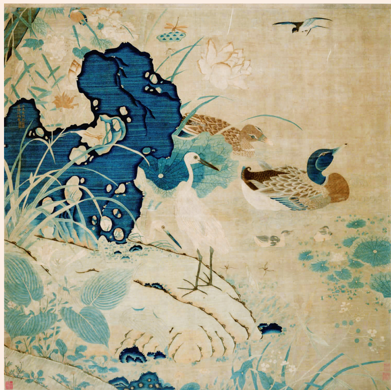
上海博物馆藏朱克柔《缂丝莲塘乳鸭图》。