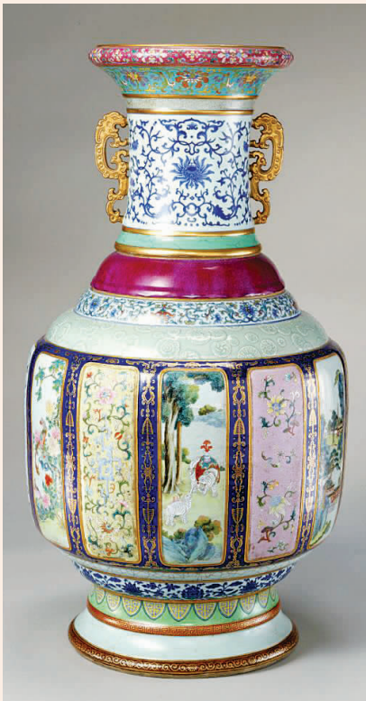
故宫博物院藏各种釉彩大瓶。