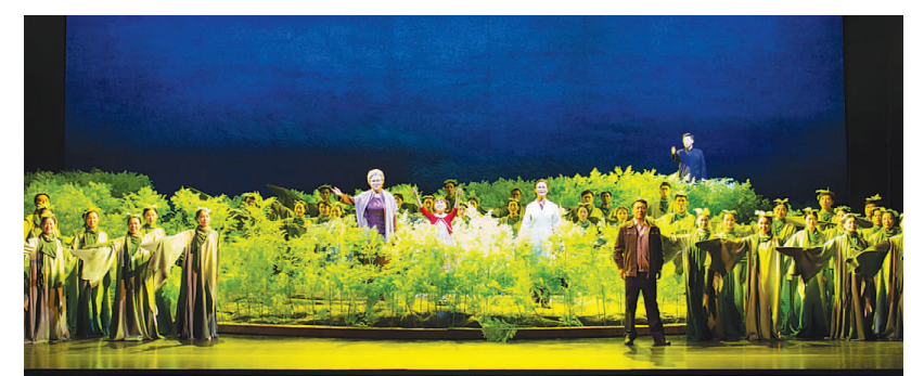
作为重要的视觉元素,青蒿这种植物贯穿于整部歌剧。

歌剧从屠呦呦的生活和工作情节入手,通过对唱、重唱,揭示人物之间的情感及矛盾冲突,使整个故事更有张力和感染力。该剧导演廖向红说,创作民族歌剧,选材、编剧和音乐都同等重要。要创作出能够经受住时间考验的经典之作,既要懂得歌剧的艺术特点,音乐更要让中国观众入耳、入心,更要做好题材的选择。青年歌唱家吕薇在剧中饰演屠呦呦,为了解、体验中医药工作者的日常生活,她和剧组全体演员阅读了大量书籍、报刊,还专门去药品检验所参观学习,了解做实验、采标本的过程,为演出积累第一手素材。她表示:“《呦呦鹿鸣》作为一部现实题材的歌剧,在表演中不能采用夸张的表现手法。无论是导演还是演员,都非常认真,尽量还原最真实的场景。”