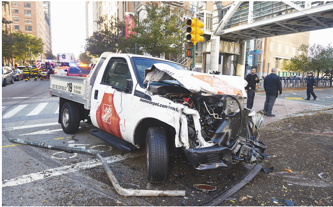
恐袭嫌疑车辆停下时已被撞得变形,而嫌犯则下车开枪射击。

纽约市警务专员詹姆斯·奥尼尔在发布会上说,嫌疑车辆当场撞死6人,另有13人受伤送医,其中两人在送医后不治身亡,11人伤势严重,但没有生命危险。