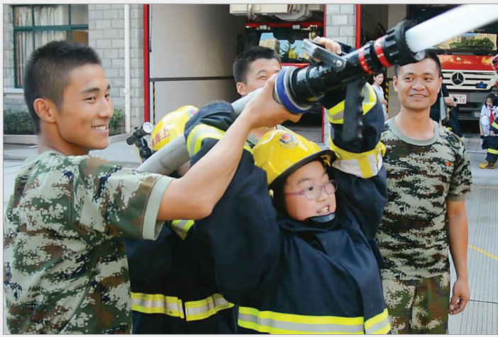
▲青少年走进消防队，学习消防知识，体验部队生活。寓教于乐的形式让孩子们带动家庭，从而提升群众消防安全意识。