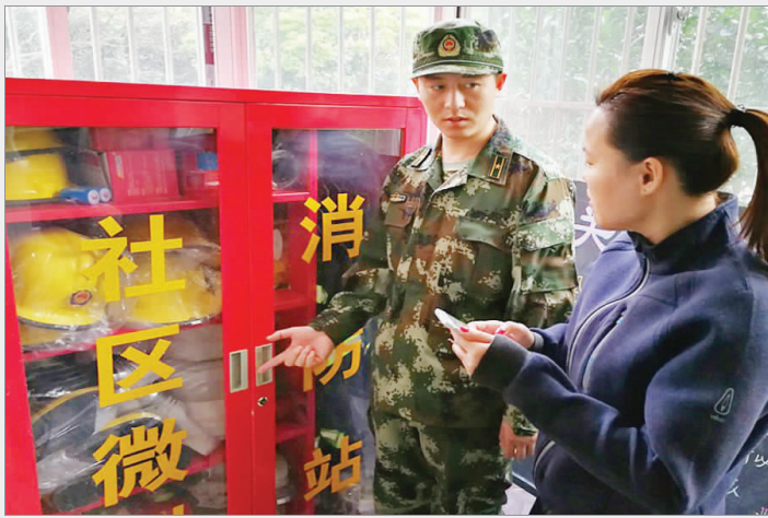
▲推动基层单位建立微型消防站，着力打造良好的消防安全环境。