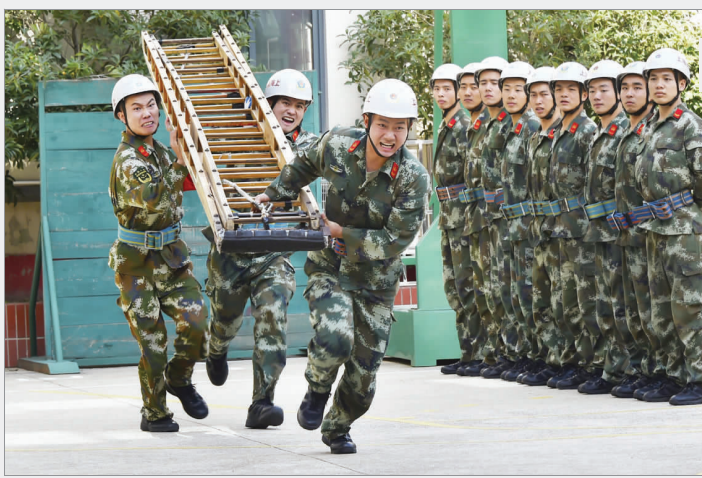
▲练就过硬的消防业务技术，不断提高自身的体能和业务素质。