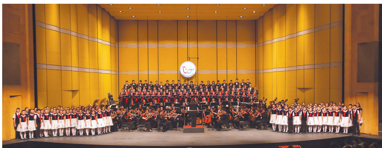
第十九届中国上海国际艺术节昨拉开帷幕,交响合唱《启航》是此次艺术节的开幕演出。