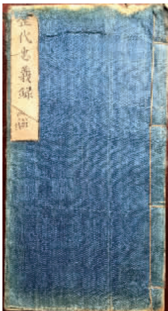
◀图1 中国本线装，一般为四眼装订。天一阁博物馆藏

明代的线装书和宋体字影响到中国周边的日本、朝鲜半岛和越南等国家和地区，在日本和韩国，宋体字至今仍被称为“明朝体”；甚至19世纪欧洲出版的书籍中使用的汉字也是宋体字。线装书和宋体字成为传统书籍装帧和印刷的规范。这种规范随着书籍一起向世界传播，使其不仅为中国书籍的规范，而且长期成为东亚汉籍的规范。明代书籍是汉字文化圈形成以后推动其多元发展的重要工具，也是中华文明在世界范围内传播的重要载体。