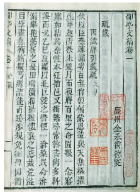
图6 《邵亭文稿》所用宋体字为全史字，是朝鲜时代朴宗庆根据乾隆内府刻本《二十一史》的宋体字铸造的金属活字。华东师大图书馆藏