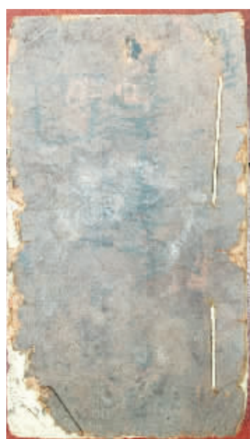
▶图4 越南本线装，用纸捻作蚂蝗攀式装订。