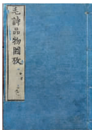
▲图3 日本本线装，四眼线装，各眼间距大致相等。天一阁博物馆藏